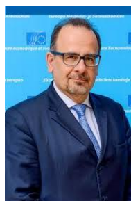
Luca Jahier, Presidente CESE

Con ocasión del Día Internacional del Trabajo, el Presidente del CESE, Luca Jahier señaló que Europa continúa preocupada por los altos niveles de desempleo, que afectan especialmente a los jóvenes. Destacó, asimismo, que el riesgo de exclusión social y pobreza nunca había sido tan elevados y que el problema de los trabajadores pobres, esto es, de aquellos cuyos ingresos caen por debajo de una línea de pobreza, socava el progreso social. Ello, unido a la no resuelta crisis