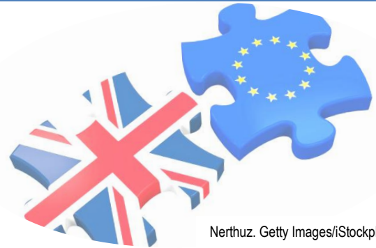
Nerthuz. Getty Images/iStockphoto

La semana siguiente May volvió a cobrar protagonismo. Por un lado, realizó un discurso ante el Parlamento británico en el que insistió en sus mensajes tradicionales y señaló que no cedería al “backstop” propuesto por la Unión Europea.